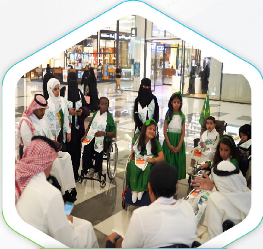
تفعيل اليوم الوطني السعودي 93 ، في النخيل مول بمشاركة عدد من المستفيدين

احتفالية موظفين جمعية سواعد بمقر الجمعية بمناسبة اليوم الوطني السعودي 93